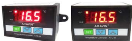
Bộ điều khiển nhiệt độ độ ẩm kết nối RS485