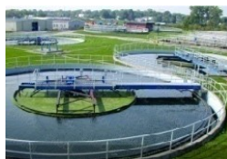
Xử lý nước