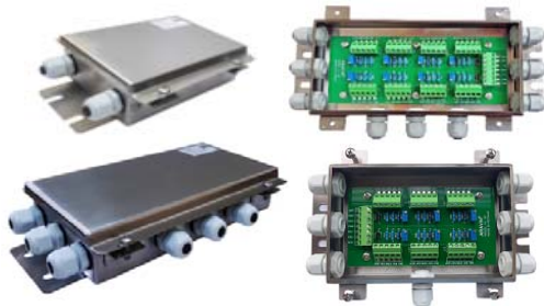
Hộp cộng Load cell