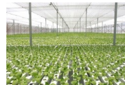
Nông nghiệp, môi trường

Cảm ơn quý khách hàng đã quan tâm và hợp tác cùng chúng tôi trong thời gian qua.