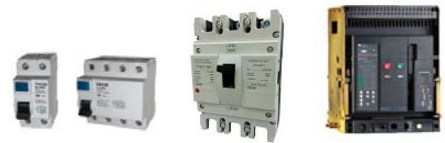
Chống dòng rò