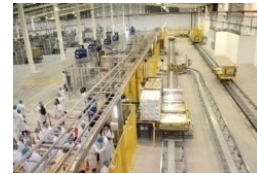
Thiết bị phụ trợ, bao bì