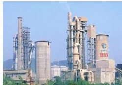
Xi măng, vật liệu xây dựng