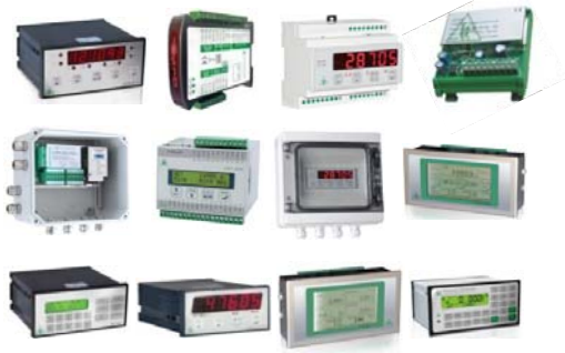
Đồng hồ cân