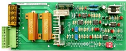
Bo mạch điều khiển van tỷ lệ tải nặng