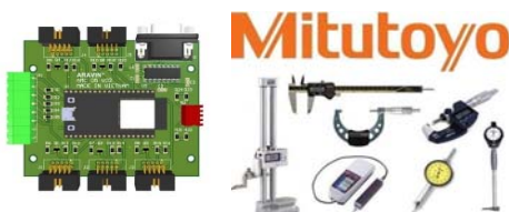
Card kết nối thiết bị Mitutoyo