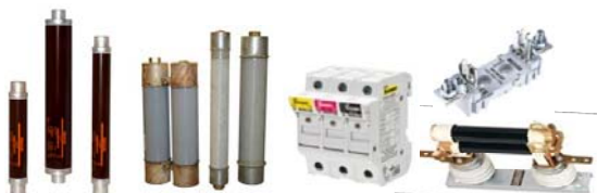
Cầu chì trung thế