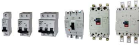
MCB - MCCB