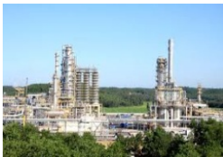
Dầu khí, nhiệt điện

TTH Việt Nam là một trong những công ty uy tín trong việc ứng dụng các giải pháp tổng thể, tích hợp hệ thống điện và tự động hóa trong nhiều lĩnh vực: