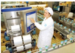
Thực phẩm, đồ uống